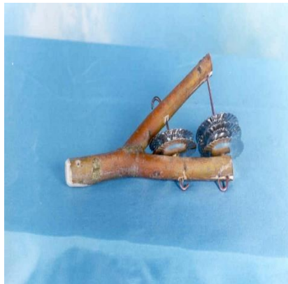
SONAJERO DE SEMILLAS