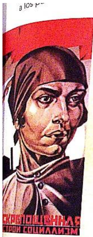
El Partido Comunista soviético, que impuso la igualdad mediante la abolición de la propiedad privada, expresa a la extrema izquierda.