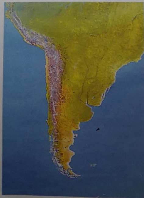
Imagen satelitaria del Cono Sur.

■ El punto extremo oeste está representado por un punto del cordón Mariano Moreno, en el Parque Nacional Los Glaciares, en Santa Cruz, cuyas coordenadas son 49^{\circ} 33' latitud sur y 73^{\circ} 35' longitud oeste.