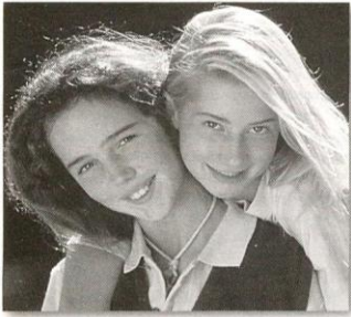
Las normas morales nos ofrecen pautas para actuar en relación con nuestros semejantes.

Sin embargo, se suele hacer una distinción entre ambos términos. La moral es el conjunto de normas que consideramos justas y obligatorias. Estas normas regulan nuestras conductas y pueden ser diferentes según la cultura o la época a la que pertenezcamos. Por ejemplo, los diez mandamientos son un conjunto de normas que conforman parte de la moral judeo-cristiana. Cuando juzgamos la conducta de los demás o cuando decidimos qué hacer en una situación determinada, tenemos en cuenta esas normas. La moral que rige en nuestra sociedad no ha sido inventada por nosotros pero somos nosotros quienes la aplicamos.