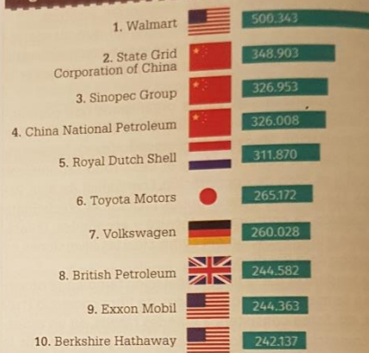
[FIG. 44] Las mayores empresas del mundo, según sus ingresos en millones de dólares (2018)

Casi el 80 % de las multinacionales tiene su sede en países centrales, principalmente, los Estados Unidos, Alemania, el Japón, Francia, el Reino Unido, Italia y Canadá. Sin embargo, luego de la crisis de 2008, el número de empresas estadounidenses pasó de 170 a 139 y el de británicas, de 38 a 29. En cambio, con el ascenso de China y el Brasil, el número de empresas de países en vías de desarrollo está creciendo.