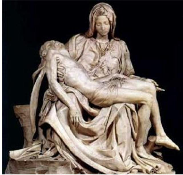
Imagen de Escultura tridimensional.