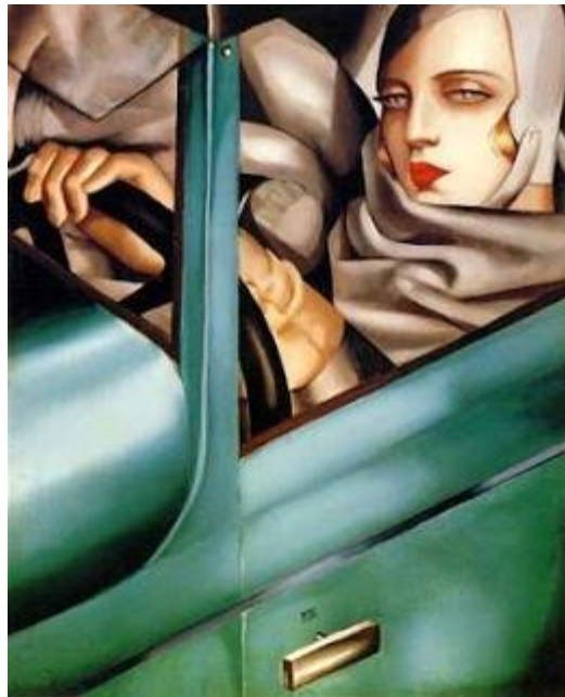
Imagen en bidimensión.