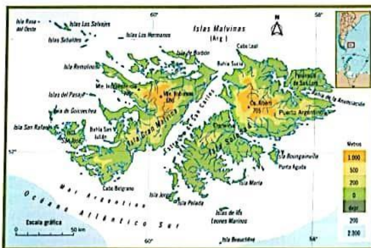
Mapa político de las Islas Malvinas Argentinas

▪ A partir de la reforma de la Constitución Nacional de 1994 se incorporó el tema del reclamo de soberanía sobre el archipiélago como política de Estado. Desde ese entonces se llevaron a cabo exposiciones en las distintas asambleas generales de las Naciones Unidas, pero el Reino Unido se niega a dialogar con el fin de solucionar el conflicto.