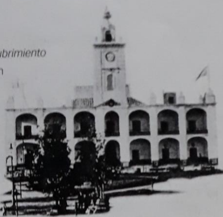
Cabildo de Santa Fe, edificio en el que sesionó la Asamblea Constituyente de 1853.

A partir de 1810, y luego de independizarse de España, los primeros gobiernos patrios organizaron la administración y la distribución territorial. Una vez disuelto el Virreinato del Río de la Plata, la organización política se entretejió a partir de las ciudades ya fundadas y comenzaron a formarse las primeras provincias. Cuando se independizaron las intendencias de Buenos Aires, Córdoba y Salta, se formaron las provincias de Jujuy, Salta, Tucumán, Córdoba, Catamarca, La Rioja, Mendoza, San Juan, San Luis, Santiago del Estero, Buenos Aires, Entre Ríos, Corrientes y Santa Fe. Sus límites se fueron modificando hasta que quedaron fijados los actuales.