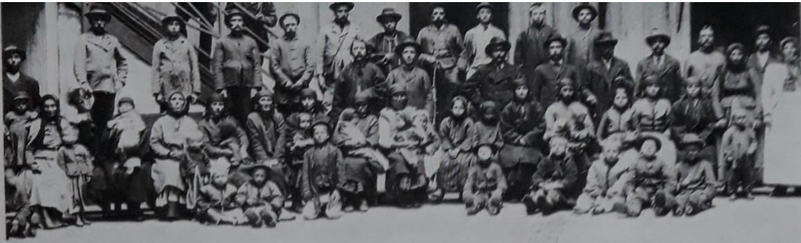
Hotel de Inmigrantes a fines del siglo XIX