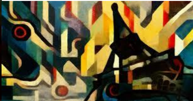
Ejemplo de una composición abstracta