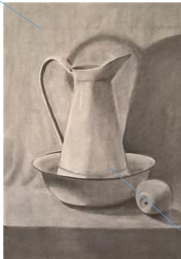
FIGURA O FORMA

La relación figura- fondo se vale de diferentes cualidades visuales. Las cuales son: