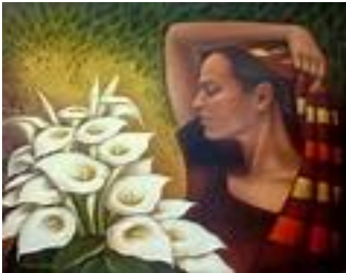
Ejemplo de una composición figurativa.

Composición abstracta: representación visual, en la cual se suprimen elementos de la realidad, y se remplazan por elementos geométricos, formas o colores subjetivos creadas por el mismo artista, Este tipo de composición se caracteriza por diferentes tipos de emociones, sentimientos y simbolismos.