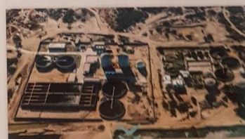
[FIG. 86] La planta desalinizadora de Israel recolecta agua del mar Mediterráneo y la pasa por múltiples filtros. Para ello se utiliza el proceso de ósmosis inversa, que permite separar elementos del agua gracias al empleo de presión a través de una membrana.

La relación sociedad-naturaleza también se modifica a través del tiempo. Los cambios tecnológicos hacen posible la obtención de recursos de manera más eficiente o rápida, llegar a reservas a las que antes no se accedía o utilizar elementos naturales que antes se consideraban inservibles. En Israel, que es un país semidesértico, el abastecimiento de agua potable era un problema crítico. Sin embargo, a partir de sistemas de desalinización, se logró transformar el agua de mar en agua apta para el consumo humano directo [FIG. 86]. A partir de esta concepción, se dice que la sociedad construye ambientes o que los ambientes son construcciones sociales .